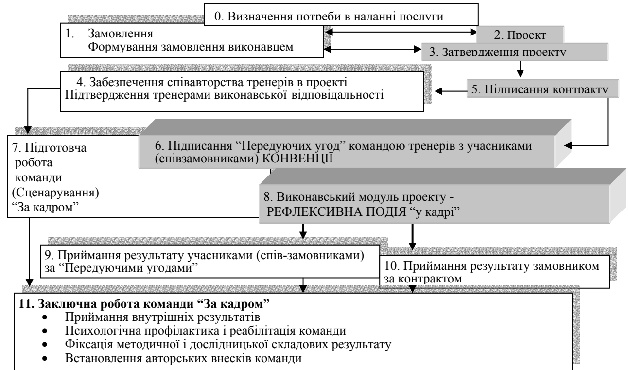
Рис. 2. Етапи реалізації груп-рефлексивної проектної технології